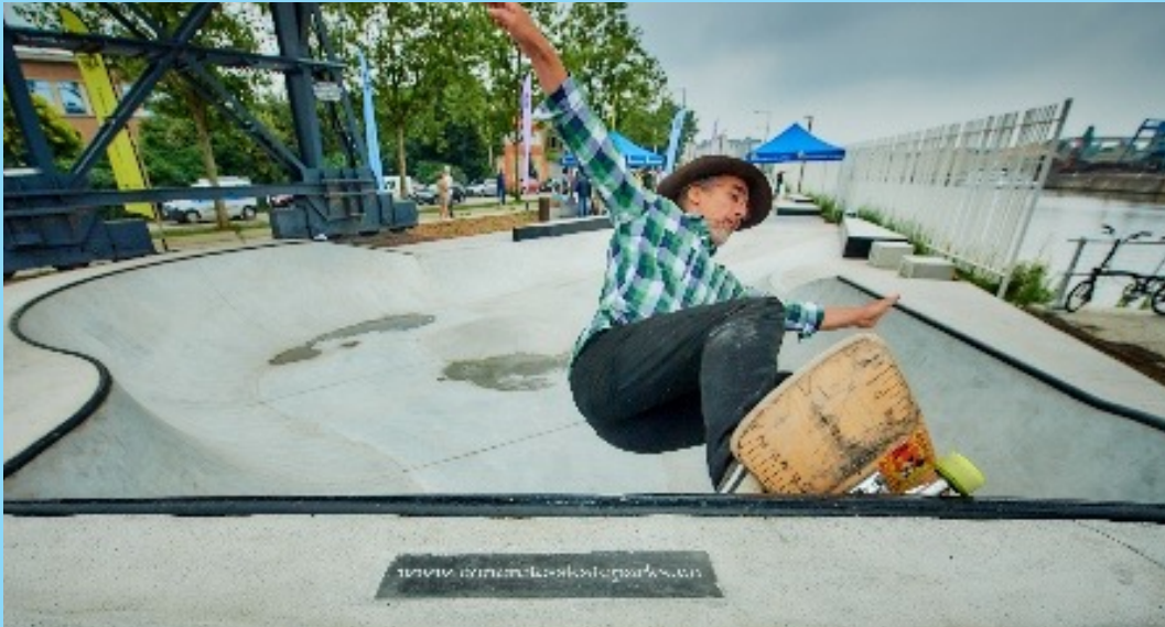
@Port de Bruxelles