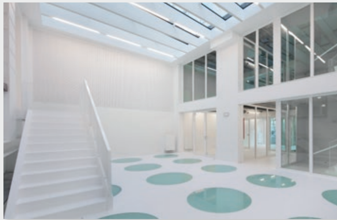
MAD, Home of creators

projet FEDER 2014-2020 « Irisphère ») ont constitué un consortium pour pallier au début de crise à la pénurie de masques de protection en Région de Bruxelles-Capitale.