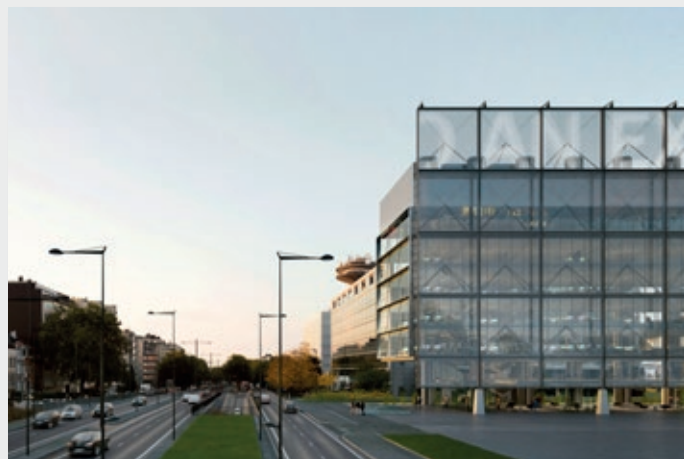
Frame, la future maison des médias de mediapark.brussels. Copyright BAUKUNST-BRUTHER.

Les travaux débuteront en 2021 et s'achèveront en 2023. Le projet est soutenu par le FEDER à hauteur de 16 millions d'euros.